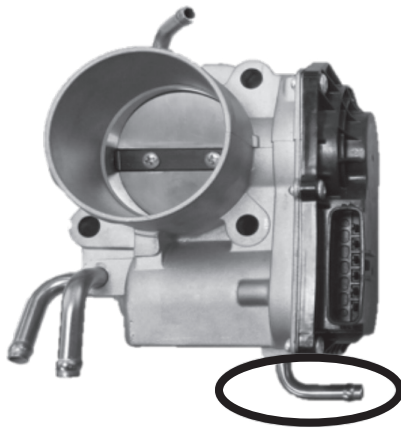
OLD MODEL / Ancien modèle / Modelo viejo